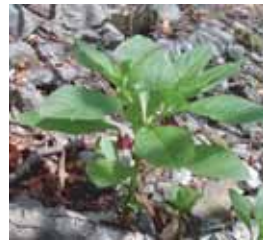
●仁田小屋の周りに多く自生するハシリドコロ。有毒のためシカやウサギに食べられないことがない。早春の植物のしたたかな知恵である。