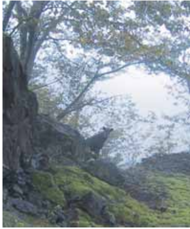
林道で出会ったカモシカ

続く槌状の滝は左をへつりながら登る。続く七m程の滝は右岸を高巻き、ゴルジュ帯を出たところが焼小屋沢出合(九時二〇分)で左の本流を進む、気持ちの良いナメ滝をピチャピチャ歩いて芋ノ窪の出合付近で早めの昼食(九時四十分)。時々、沢身の岩に川海