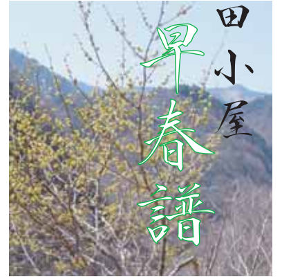
●早春の山を黄色く彩るダンコウバイ