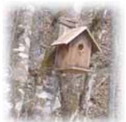
仁田小屋近くにかげられた巣箱に小鳥が営巣を始めました。

植林作業、地拵え、下刈り作業の円滑化と危険回避のため、仁田小屋から植林地まで新しいルートを開設します。作業道の開設は、植林地の見回りや森林の観察にとっても必要ですが、多くの会員の皆様が安全に植林作業に参加していただくためにも必要になります。「山の肥やしは、人の足跡」といわれていますが、より多く森に関わることを求められるのは、人工の造林地ばかりではありません。森林保全のために作業道が果たす役割は大きいといえます。