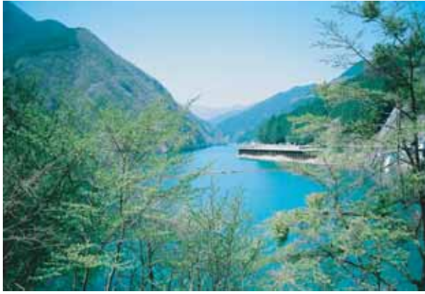
●あおい水を湛えた秩父湖