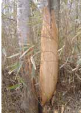
樹皮が剥がされたウリハダカエデの成木

三、シカの食害対策について 近年のシカやカモシカの個体数の増加は、植林にも大きな影響を与えています。山に植えた苗が食害のため全滅することがあり、苗を植えても木にならないと地元の多くの方が嘆かれています。現状があります。苗ばかりではなく直径三〇センチ以上に育った成木でも地上二メートルまで樹皮がはがされる