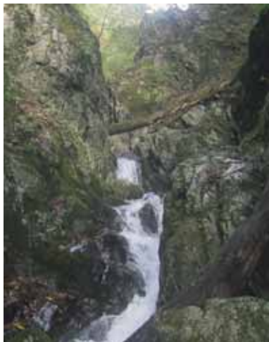
二葉瀑上の槌状の滝

苔が生えている。高校生も慣れてきたのか笑顔が初々しい。芋ノ窪の出合は右の本流へ、その直ぐ上にも小さなゴルジュ帯で水流の中を進む。小さなゴルジュ帯の上からは沢も開けてきて小さな平地も出てくるようになる。一七〇〇m付近の二股(三本木、十一時二〇分)は右の本流を進みさらに水量が