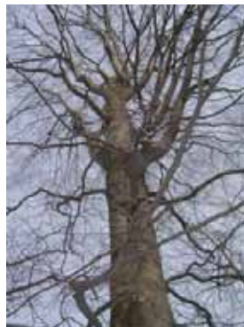
●開業まえのブナの大樹