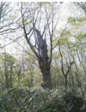
幹周り3mのミズナラ

mから広葉樹の二次林がはじまり、標高一四五〇mの「イヌブナ平」と命名した広い尾根には、ブナ、イヌブナ、ミズナラ、ウリハダカエデなどの広葉樹種が美しい林相を見せています。この地域は、山林火災の時に焼失をまぬがれた地域で、大きなブナやイヌブナが残る太平洋側の典型的な天然林となっています。このイヌブナ平に突き上げる仁田小屋沢の沢筋は、カツラ、シオジ、サワグルミ、トチなどの天然林からなり、サルナシやヤマブドウなどのつる性植物も多く、シカやクマなどの野生生物にとつては最後の楽園ともいえる地域です。天然林として残されたこれらの地域は、人の手を入れずに保護していくべき貴重な地域となっています。一四五〇mより上部からは山林火災の後に植林されたカラマツとカンバやリョウブなどの二次林となり、スズタケに林床が覆われた地域となります。私たちは、この地域にブナやミズナラなどの広葉樹種を植林することによって、より自然度の高い森林に誘導していきたいと考えています。現在はまばらなカラマツ林となつている仁田小屋尾根南面域が、ブナやミズナラの大きな森林になつたら、新緑や秋の紅葉のとき、みごとな景観を示すのではないのでしょうか。今でも和名倉には大きな切り株が残され、かつてはどれ程豊かな森林であつたかが想像されます。日本の森林は国土の約7割を占めていますが、そのうちの半分がスギやヒノキの人工林、残り半分が天然林です。その天然林の多くは、これまで