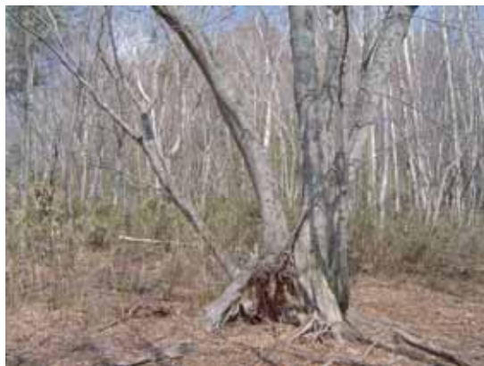
●「イヌブナ平」の名の由来となったイヌブナ。明るく陽気な早春の広葉樹林。林床のスズタケは以前にくらべ元気がない。森林衰退の始まりでなければよいのだが・・・。