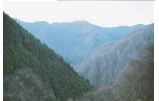
●小屋正面に望む雲取山