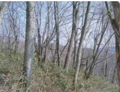
イヌブナ平付近のブナ・イヌブナ林

埼玉県下最大の山林火災により焼失した和名倉山（白石山 標高二〇三六m）の森を『水を育む山への恩返し』として復活させよう！』という呼びかけに、多くの方たちが感銘し共感を寄せていた。荒川だきました。荒川の水源の山である和名倉山は、県境を他県と接する甲武信岳や三宝山と異なり独立峰としては埼玉県では最も高く、その大きな山体や登山ルート （ト） の少なさから、豊かな自然が残された貴重な地域となっています。秩父の山々は金山などの豊富な鉱物資 源と森林資源から江戸時代には天領とされ保護されてきました。和名倉山は、その中であつて地域の共益利用が許された入会山 （いりあひ） （百姓稼ぎ山 （ひやくしやくかぎやま） ）としての歴史をもち、大滝村村有林（現秩父市）や共有林として三〇〇〇ヘクタールが残されています。私たちは「水源の森はみんなで守る」ことを活動の柱としながら、和名倉の森林再生と保護のため活動に取り組んできました。スズタケの藪に覆われ廃道となつた道の整備や山頂までの植生調査、ブナの植林や森林保全の拠点となる仁田小屋の再建などに取り組んできました。大切な水源の森を涵養する植林や森林保全の活動は、治山治水につながり、陸から海への動植物を育み、地球全体の環境保全につながっていきます。この和名倉の森をどのような森として守っていくのか、今後の植林方法をどのようにするのかなど多くの課題が残されています。